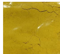
図2 菊の花エキス-WSP10の粉末

更に、各国の食品規制がクリアとなっている賦形剤を使用していることから海外での使用も可能です。