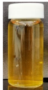
図1 菊の花エキス-WSP10の水溶液 (100mg/30cc水)

この度のルテオリン高含有水溶性粉末は、 既存品のWSPグレードと比較し規格濃度を100倍に高めており 、既存の粉末タイプ(菊の花エキス-P、非水溶性グレード)と同含量とすることで、 清涼飲料水、栄養ドリンクをはじめ各種飲料タイプでの形態で機能性表示食品への使用が可能 となります。機能性表示食品としての推奨配合量は、尿酸値対策としてルテオリン10mg/日(菊の花エキス-WSP10として、100mg/日)、アレルギー(花粉、ホコリ、ハウスダストなどによる目の不快感)対策としてルテオリン20mg/日(菊の花エキス-WSP10として、200mg/日)と、非常に配合しやすい処方設計を実現できます。