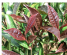
ツバキ科ツバキ属チャノキ 学名: Camellia sinensis