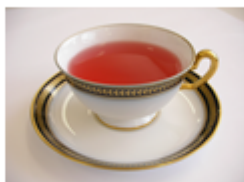
アントシアニンを含むため茶葉が赤紫色を呈する。ポリフェノールに富み、抗酸化活性が高い。